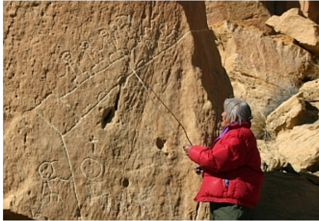
Martin e la roccia della profezia

Se questo sarà fatto, l'equilibrio delle Leggi e Forze Naturali sarà disturbato, col risultato di terremoti, importanti cambiamenti a livello meteorologico, squilibri sociali”. “ (...) il giorno della Purificazione i veri Hopi voleranno verso altri pianeti in 'vascelli senza ali' 3 . ”